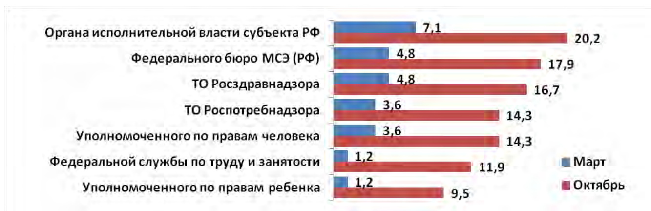
Диаграмма 6. Оценка заполненности блока «Контролирующие организации» (в % от общего количества сайтов ГБ МСЭ)