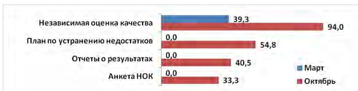
Диаграмма 5. Оценка заполненности блока «Независимая оценка качества» (в % от общего количества сайтов ГБ МСЭ)