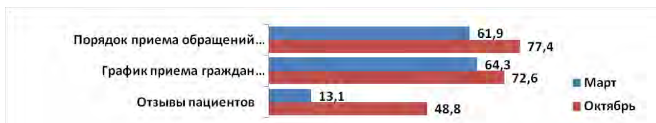
Диаграмма 3. Оценка заполненности отдельных аспектов блока «Обратная связь» (в % от общего количества сайтов ГБ МСЭ)